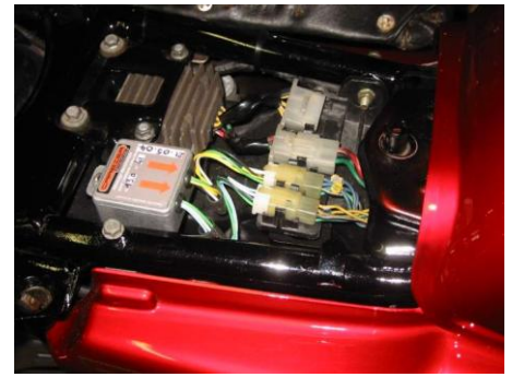
Le module en place sur une Honda CB650. The ignition module in place on a Honda CB650

To the genuine connector from the harness Vers le connecteur du faisceau d'origine